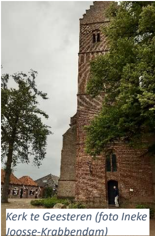
Kerk te Geesteren

in het beeld dat we van ze hebben: ze zijn niet in Geesteren geboren en getogen, maar als jong getrouwd echtpaar vestigen ze zich in dit dorp.