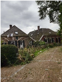
Boerderijen aan de Steenstraat nu Dorpsstraat

Het toeval(?) wil dat ook deze registratie van alle buurtschappen bewaard gebleven is. iii Uit dit document lezen we de eigenaars en pachters van huizen, hofsteden, bouw- en weilanden af en het onroerend goed van de eigenaars en pachters aan de 'Steenstraat' te Geesteren. De straat heet Steenstraat, omdat die al vroeg verhard is. Gezien de registratie zijn de bewoners