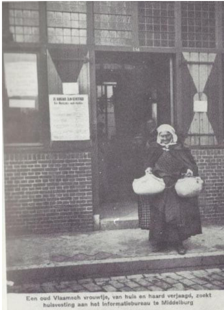
Een oud Vlaamsch vrouwtje, van hula en haard verjaagd, zoekt huiavesting aan het Informatiebureau te Middelburg