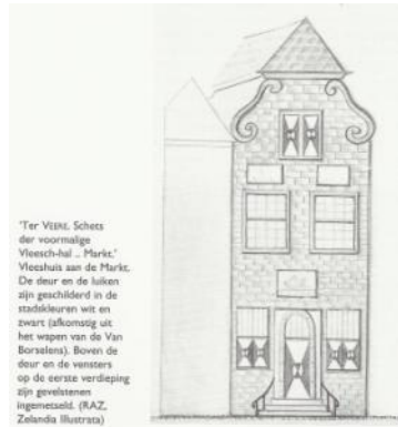
'Ter Vliet, Schets der voormalige Vleeshal aan de Markt.' De deur en de luiken zijn geschilderd in de stadsleuren wit en zwart (afkomstig uit het wapen van de Van Borselen). Boven de deur en de vensters op de eerste verdieping zijn gevelstenen ingemetseld.